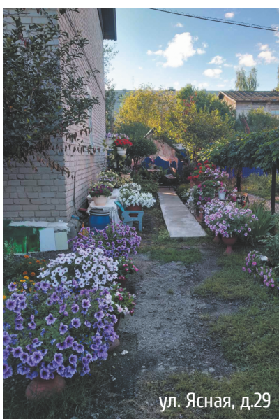
ул. Ясная, д.29

От редакции. Мы обратили внимание, что в ЖК «Корабли» полностью отсутствуют цветочные клумбы, созданные руками жителей. Как заверили нас в управляющей компании «Корабли НН», там готовы поддерживать инициативных жителей – выделить семена и завести плодородный грунт. Надеемся, что такие жители найдутся, и следующим летом, палисадники в ЖК «Корабли» порадуют буйством красок и цветов.