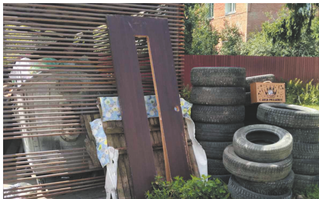
ул. Красносормовская, д. 25 – ПРИМЕР ТОГО, КАК ДЕЛАТЬ НЕЛЬЗЯ!

«Шины (покрышки) и автомобильные камеры не