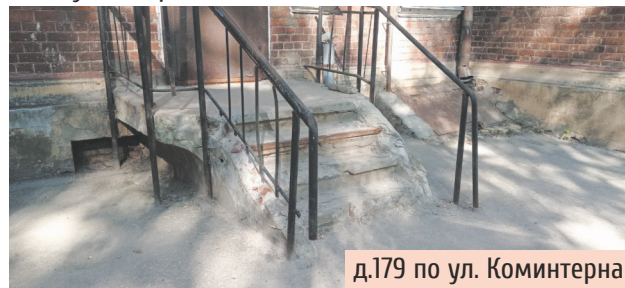
д.179 по ул. Коминтерна

случится пожар? Этой зимой сотрудниками управляющей компании во время очистки крыши были повреждены ещё и козырьки входных групп – на них образовались вмятины и пробоины. Водосточные трубы тоже сломали и до сих пор не восстановили, и в результате вода стекает прямо по фасаду, разрушая его. Лестница перед входом в подъезд тоже вся разрушена! Зимой дорожки покрыты льдом. Регулярно обращаемся в управляющую организацию с требованиями устранить проблемы дома, но она продолжает бездействовать. Видимо, нашим следующим шагом будет обращение в суд, а также выбор другой управляющей компании. Очень хочу добавить, что мы очень любим свои дома. Они уникальны, относятся к объектам культурного наследия и сохранить их – это не только обязанность государства, но и нас жителей. Будем бороться за наши дома до последнего!»