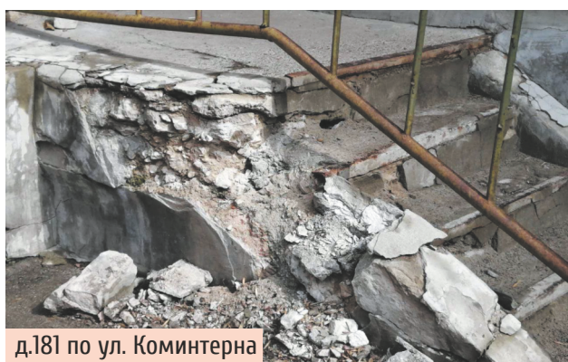
д.181 по ул. Коминтерна

«Наши жители приняли решение о смене управляющей компании. За 4 года техническое состояние домов приблизилось практически к аварийному! Подвалы затоплены то кипятком, то холодной водой. Наши крыши в начале 2000-х годов были капитально отремонтированы предыдущей компанией, которая следила за ними, а в зимний период аккуратно очищала от снега и наледи. А нынешняя компания при очистке от снега повредила нам всю кровлю. Теперь водой заливает подъезд и всю лестницу, стены мокрые. Из-за этого страшно пользоваться электрикой. Причем, все провода хаотично и беспорядочно свисают вдоль стен дома. А если проводку замкнет и