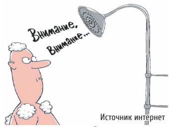
ГРАФИК ОТКЛЮЧЕНИЯ ГОРЯЧЕЙ ВОДЫ

АО «Теплоэнерго» скорректировало графики плановых отключений горячей воды. Корректировки потребовались в связи с повторным возобновлением отопительного периода с 7 по 20 мая. Обновленный график доступен на главной странице сайта АО «Теплоэнерго» – teploenergo-nn.ru . Выбрав улицу и номер дома из списка, можно увидеть периоды отключения горячей воды в конкретном доме. Если адреса вашего дома нет в списке сервиса «График отключений горячей воды», вероятно, АО «Теплоэнерго» не является вашей ресурсоснабжающей организацией. Телефон горячей телефонной линии АО «Теплоэнерго»: 277-91-31.